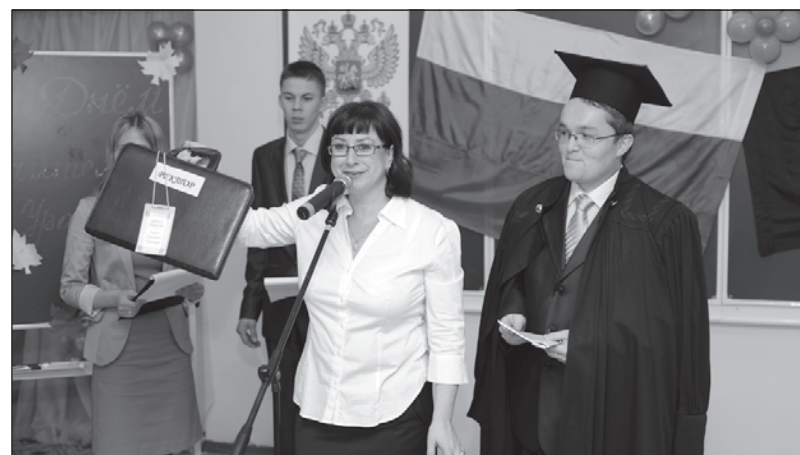
Только в надежные руки!

Сказать честно, ничего веселого или простого (а именно так я думала раньше) в этой работе нет. Весь день я бегала, общалась со студентами, обзванивала их. День показался мне насыщенным. А потом, когда сотрудники деканата сели печатать письменный отчет о проделанной работе, то оказалось, что отчет умещается в два предложения! Но эту работу проделали Мы!